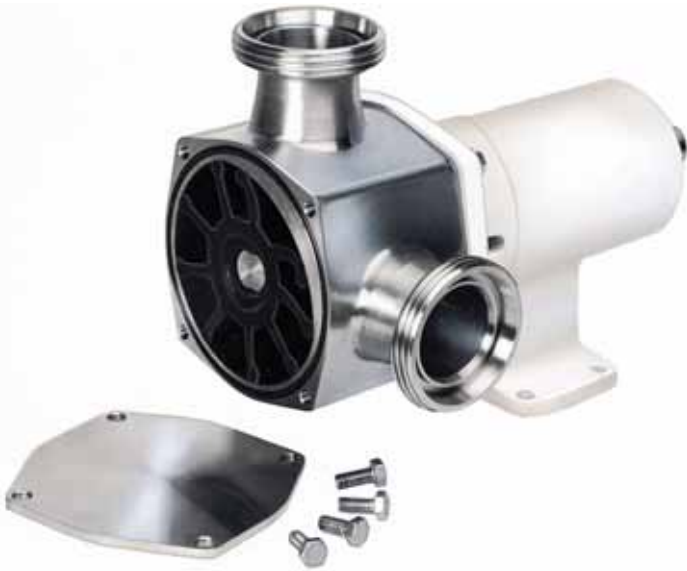
Afb. 4 Impellerpomp

ven. Om die reden wordt vaak gekozen voor roestvaststaal, afhankelijk van het werkingsprincipe nog in combinatie met gecertificeerde elastomeren. Ook gelden eisen voor de oppervlakterutheid van de toegepaste materialen.