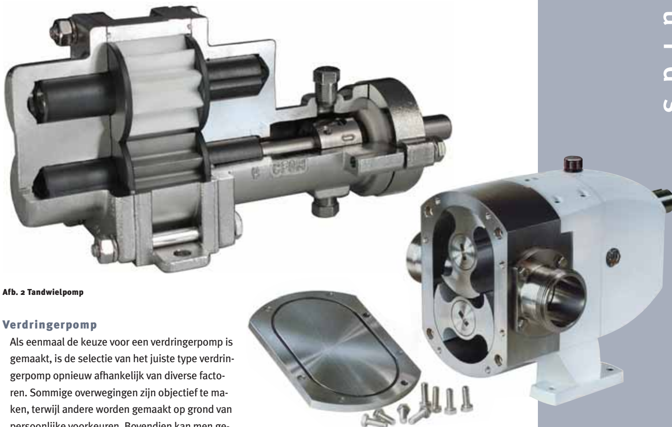
Afb. 2 Tandwielpomp