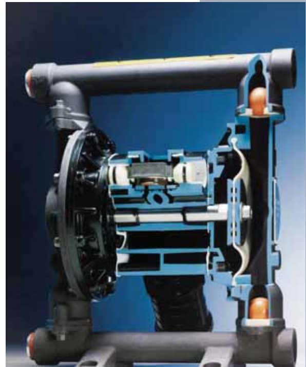
Afb. 5 Membraanpomp

ten. Tandwiel- en rondselpompen vertonen daarentegen wel een afnemende capaciteit bij slijtage.